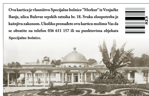
Позадња страна идентификационе картице

Објекти Специјалне болнице „МЕРКУР“ су опремљени лифтовима и косим равнима за лица са инвалидитетом. Све особе са инвалидитетом које користе услуге СБ „МЕРКУР“ могу добити пратњу медицинског особља, уколико немају пратиоца.