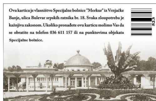
Полеђина идентификационе картице

Објекти Специјалне болнице „МЕРКУР“ су опремљени лифтовима и косим равнима за лица са инвалидитетом. Све особе са инвалидитетом које користе услуге СБ „МЕРКУР“ могу добити пратњу медицинског особља, уколико немају пратиоца.