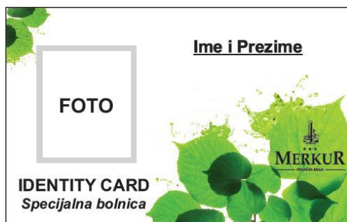
Предња страна идентификационе картице

Запослени у Специјалној болници „МЕРКУР“ су обавезни да носе идентификационе картице, које изгледају овако: