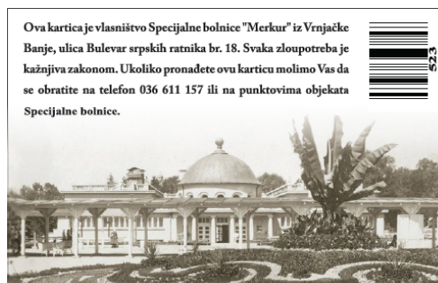
Полеђина идентификационе картице