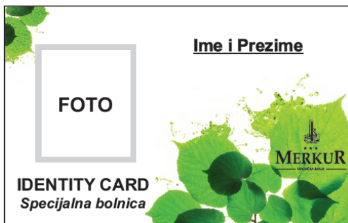
Предња страна идентификационе картице

Запослени у Специјалној болници „МЕРКУР“ су обавезни да носе идентификационе картице, које изгледају овако: