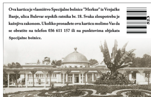
Полеђина идентификационе картице

Објекти Специјалне болнице „МЕРКУР“ су опремљени лифтовима и косим равнима за лица са инвалидитетом. Све особе са инвалидитетом које користе услуге СБ „МЕРКУР“ могу добити пратњу медицинског особља, уколико немају пратиоца.