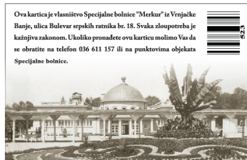
Полеђина идентификационе картице

Објекти Специјалне болнице „МЕРКУР“ су опремљени лифтовима и косим равнима за лица са инвалидитетом. Све особе са инвалидитетом које користе услуге СБ „МЕРКУР“ могу добити пратњу медицинског особља, уколико немају пратиоца.