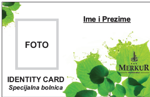
Предња страна идентификационе картице