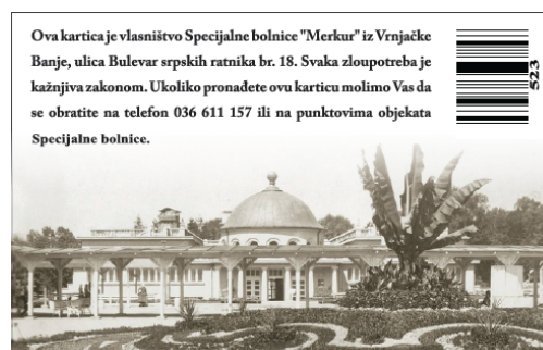
Позадња страна идентификационе картице

Објекти Специјалне болнице „МЕРКУР“ су опремљени лифтовима и косим равнима за лица са инвалидитетом. Све особе са инвалидитетом које користе услуге СБ „МЕРКУР“ могу добити пратњу медицинског особља, уколико немају пратиоца.